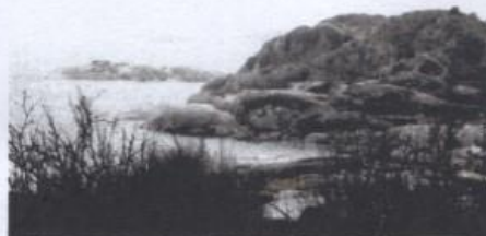
Kortvåg: Snabbsändningsmottagare någonstans i Sverige