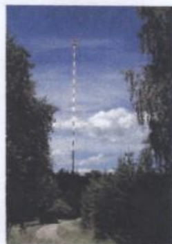
Långvåg: Ruda Radio