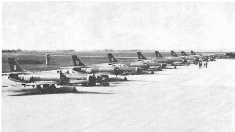
En division "Lansar" klargöras före flygning.

förbanden fick stå till tjänst både dag och natt.