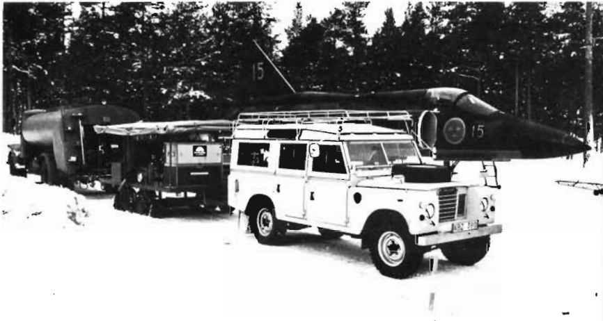
◀ Tankbil, klargöringsvagn med dragfordon på klargöringsplats. — T h: Fpl 37 'Viggen' startar från vägbas.