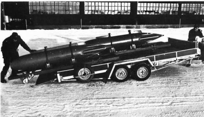
◀ Ny transportvagn för hantering av fpl-vapen. — T h: Fpl 35 'Draken' taxar upp från bergshangar.