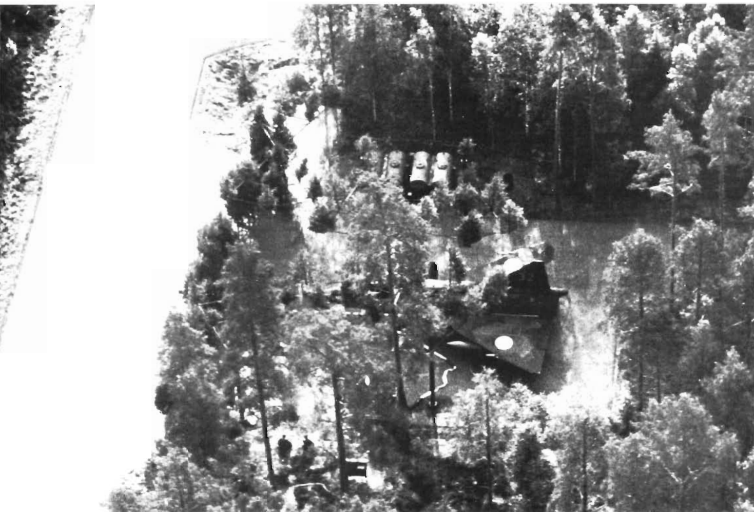
● Maskerad Viggen på klargöringsplats. I krig omplaceras nationalitetsbeteckningarna.

Det ökade antalet delsystem i varje flygplan har dock fått till följd, att det blir större volym av utbytesenheter och reservkomponenter som skall hanteras. Detta kräver en väl utvecklad verkstadsorganisation. Ser man sedan på den komplexa hotsituationen mot en flygbas finner man, att vi i framtiden – trots att man söker rationalisera inom vissa funktioner – måste räkna med en personalutökning. Härvid är det främst i basförbandens krigsorganisation som en utökning fordras för att lösa uppgifter inom andra under-