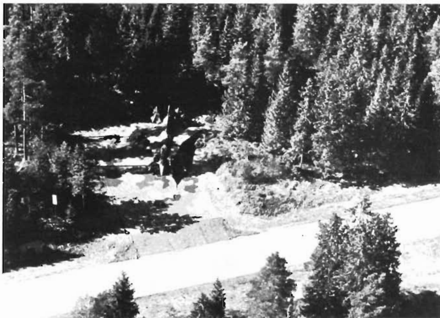
● Enbart färgkamouflage på fpl och platta ger ett första skyl.

Inom bassystemet betyder varje arbetsinsats väldigt mycket för vår