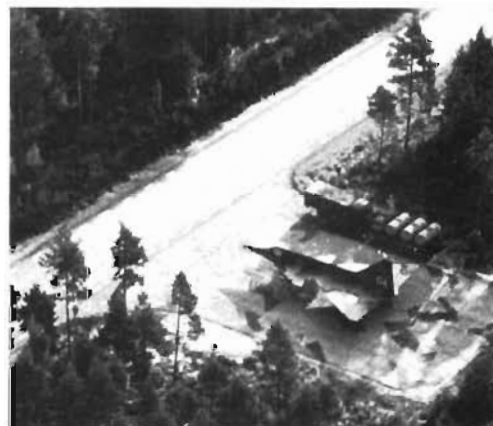
Skenmål/fpl-atrappor vilseleder en an-gripares spaning och försvårar hans bekämpning av våra krigsbaser.