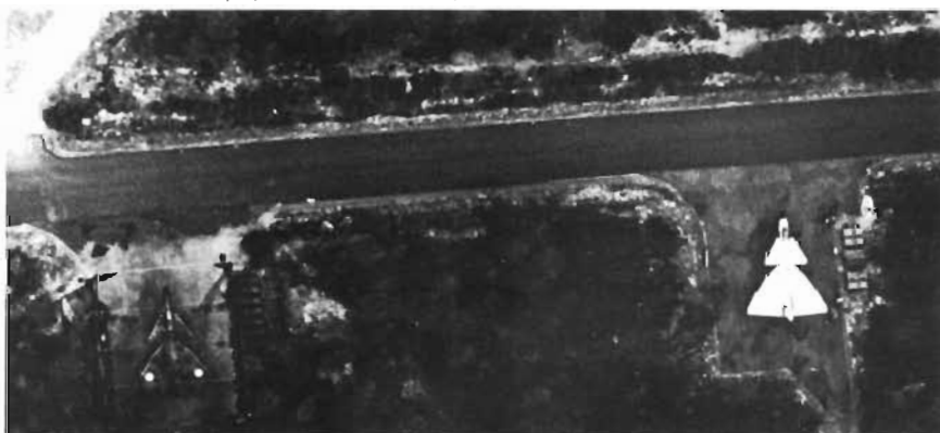
● Okamouflerade fpl på marken är lättupptäckta mål.