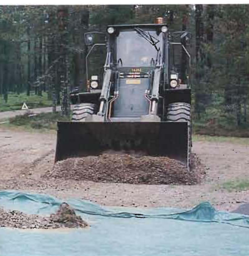
Marken saneras efter en fingerad kemikalieolycka.