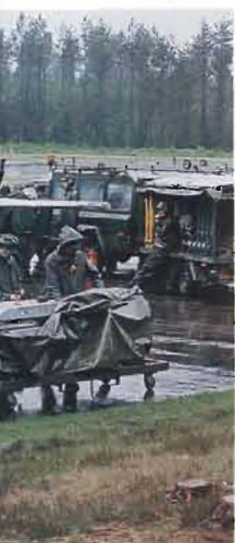
ordning inför klargör-