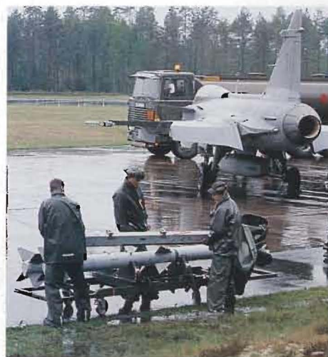
I bister regnväder görs robotar av typ Rb 99 Avenging av en JAS 39 Gripen på Hagshultsbasen.

är en ständigt levande process. Under FVÖ 02 kan vi prova hur organisationen fungerar i praktiken och det är också ett bra tillfälle att prova den stora mängd med ny materiel som tillkommer.