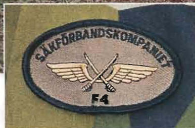
Från F 4 kom de soldater som ingick i insatskompaniets flygbassäkerhetspluton. De ryckte in förra året och hade inför sin slutövning under FVÖ 02 förtränat med en övningsvecka i Norrland.