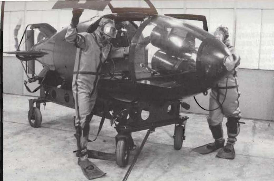
Marinen har inköpt minibusar.