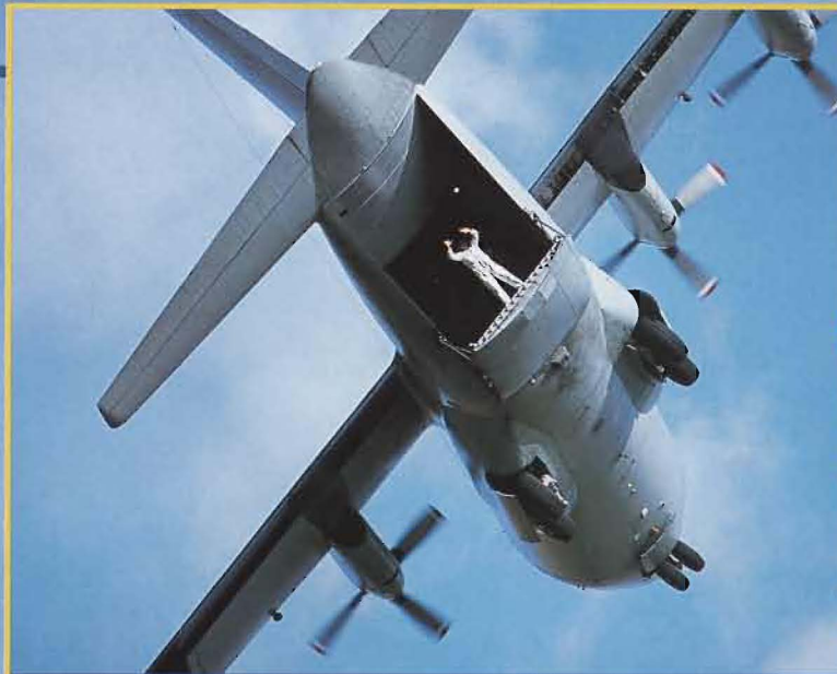
En av lastmästarna i TP 84 Hercules vinkar till publiken från den nedfällda last