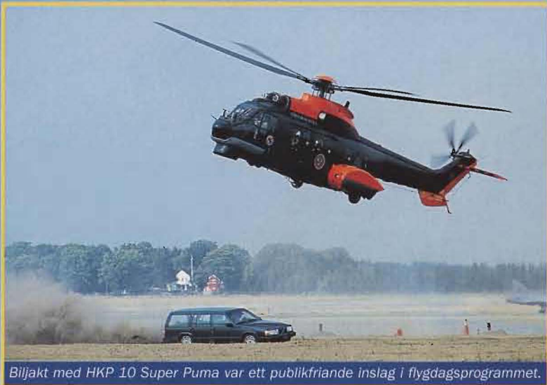
Biljakt med HKP 10 Super Puma var ett publikvänligt inslag i flygdagsprogrammet.