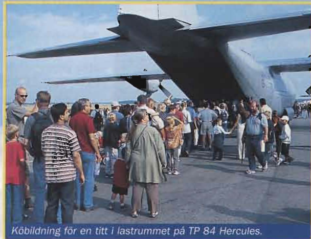
Köbildning för en titt i lastrummet på TP 84 Hercules.