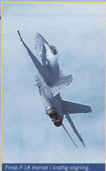
Finsk F-18 Hornet i kraftig stigning.