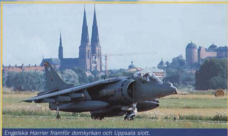
Engelska Harrier framför domkyrkan och Uppsala slott.