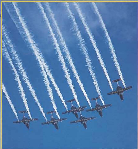
Team 60 har äntligen rökaggregat på flygplanen. Effektfullt.