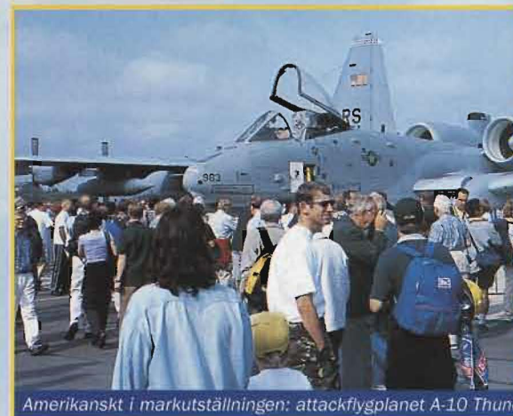
Amerikanskt i markutställningen: attackflygplanet A-10 Thunder