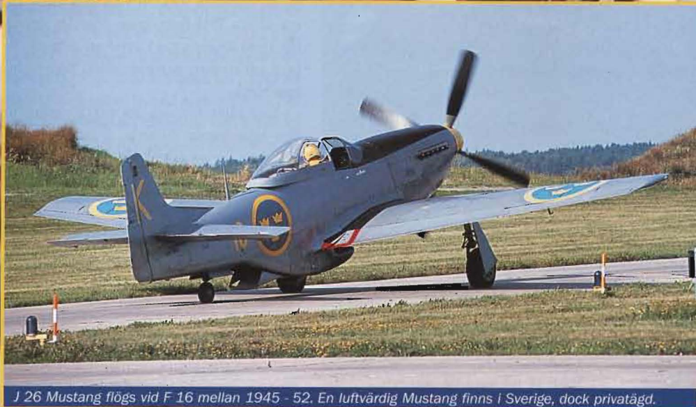
J 26 Mustang flögs vid F 16 mellan 1945 - 52. En luftvärdig Mustang finns i Sverige, dock privatägd.