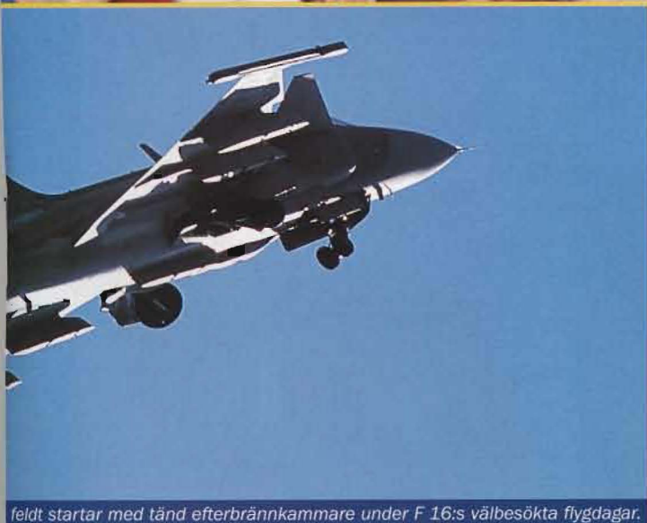
feldt startar med tänd efterbrännkammare under F 16:s välbesökta flygdagar.

Helikopterflottiljen visade upp sin HKP 10 Super Puma som är baserad i Uppsala. På plats var också uppvisningsgruppen Arméns vingar, vars konster med två HKP 9 trollbinder på vilken flygdagspublik som helst i världen.