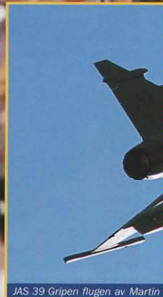
JAS 39 Gripen flugen av Martin