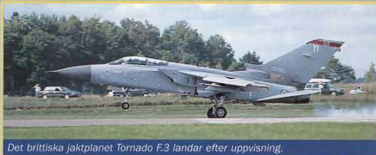
Det brittiska jaktplanet Tornado F.3 landar efter uppvisning.