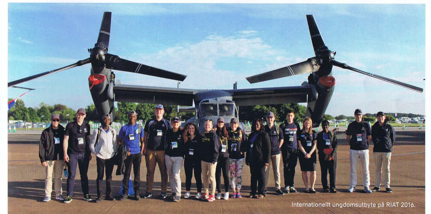
Internationellt ungdomsutbyte på RIAT 2016.