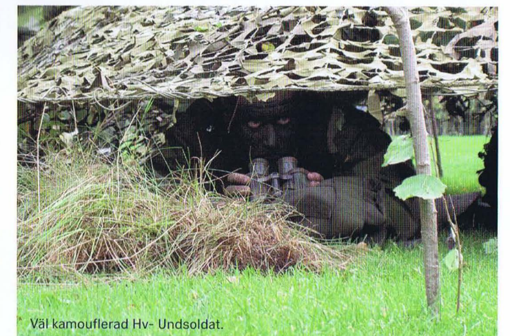
Väl kamouflerad Hv- Undsoldat.