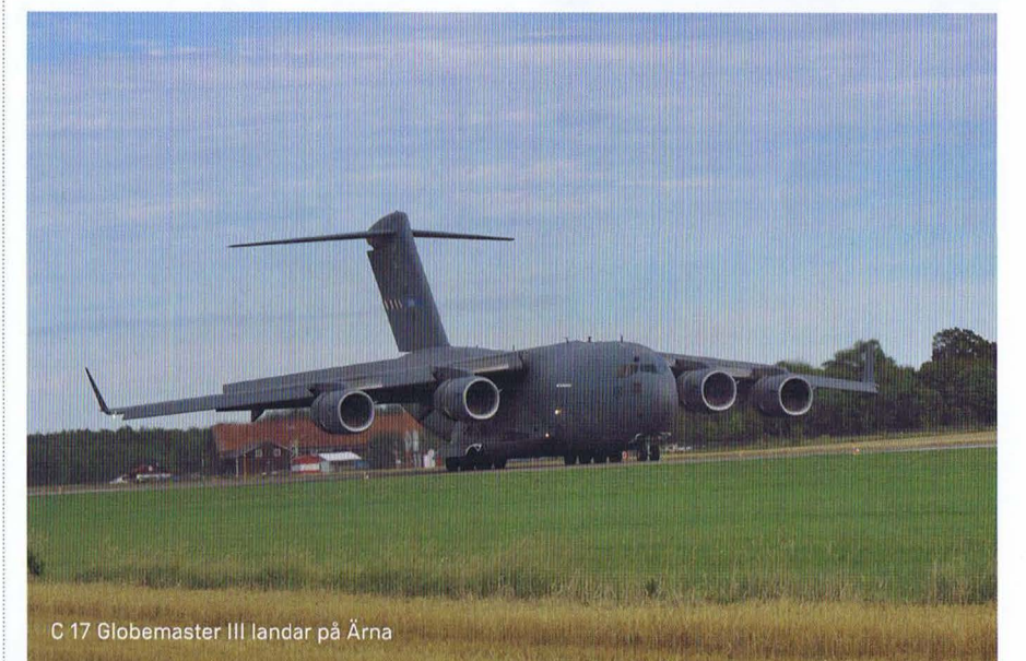
C 17 Globemaster III landar på Årna