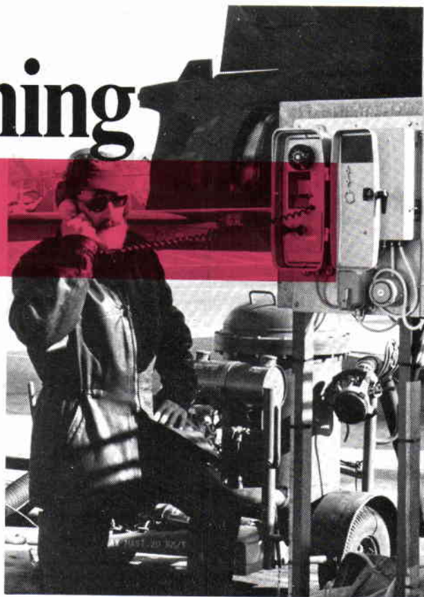
När handmikrotelefonen i telefonapparaten av "taxityp" lyfts av utgår anrop automatiskt till klagöringsexpeditionen.

□ CFV gav därför FMV-F:LT i uppdrag att ordna ett telefonsamband mellan klagöringsexp och uppställningsplatser för flygplan i fredsverksamhet.