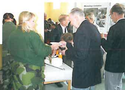
Hugade invigningsdeltagare serverades ärtsoppa av Hemvärnet.