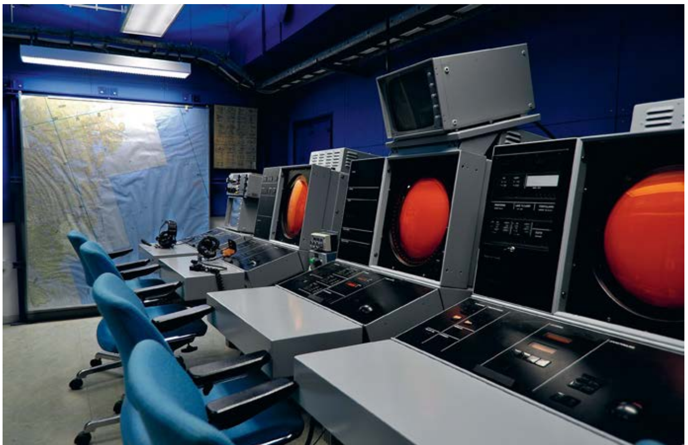
Hemsö har många avancerade faciliteter här ses ledningscentralen.

Det tunga batteriet är fortfarande bestyckat med tre så kallade torndubbelpjäser om vardera två 15, 2 cm eldrör. Eldrören är av typ skeppspjäser m/41, byggda hos Bofors i slutet på 1930-talet. Från början var de ämnade för export till Siam, dagens Thailand, och deras kungliga flotta. Exportförbudet under kriget hindrade affären och eldrören hamnade istället bl a på Hemsön, nu som fästningsartilleri m/51. Deras maximala skottvidd var 22 km, effektiv skottvidd; 18 km.