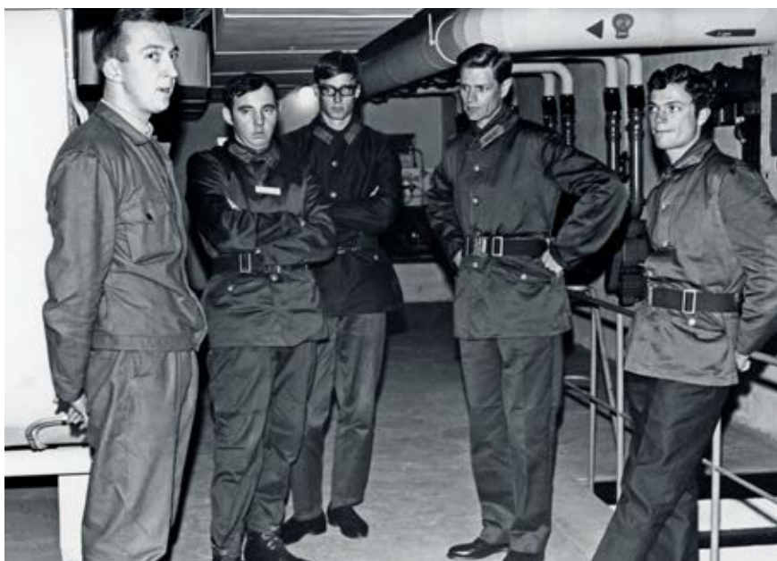
Vpl 001 Kronprinsen har naturligtvis fått grundutbildning på Hemsö. Här på ett fotografi från oktober 1967.

De strategiska förhållandena kom också att ändras med tiden. Orsaken var Sundsvallriktningen, en av tre uppskattade huvudsakliga anfallsvägar för Röda armén över svenskt territorium (de två övriga var Nordkalotten och Skåne), som behärskade de svenska militära doktrinerna under 1970- och 1980-talen. Den riktningen låg 70 km söder om Ångermanälven, med tyngdpunkt