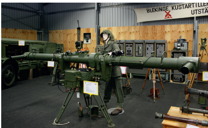
4 meters avståndsmätare stereo m/40.

Utvecklingen tog framförallt fart under senare delen av 1920-talet och det var även då motoriseringen började på allvar. Innan denna period var pjäserna hästdragna eller förflyttades av manskapet.