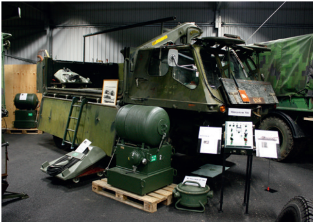
Amfibiebil 101 C (ALVIS) samt delar av minsystem M6.