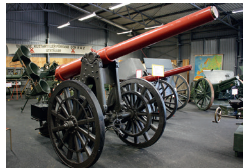
12 cm kanon m/1885.