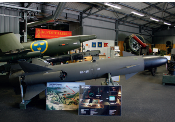
I förgrunden kustrobot 15 och bakom den kustrobot 08.

Rörlig spärrbataljon bestod av ett stabsbatteri, ett kanonbatteri 7,5 cm m/65, ett lätt robotbatteri samt en minspärrtropp.