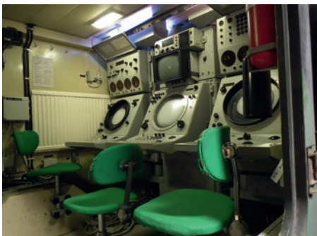
Interiör mätstation 719.

Det rörliga kustartilleriet utvecklades i huvudsak vid KA 2. >>>