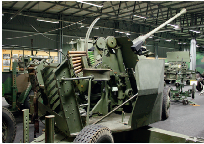
40 millimeters luftvärnskanon m/48.

Kustartilleribataljon 12/80 utgjordes av ett stabsbatteri och två kustartilleribatterier 12/80 med fyra 12 cm kanoner i varje batteri.