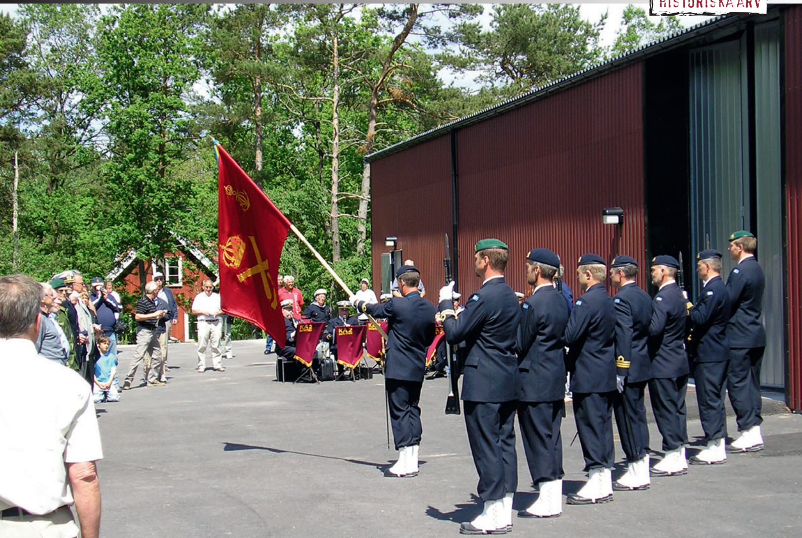
Invging av museet 2005-06-22.

fanns naturligtvis inte vid denna tidpunkt, men platserna befästes redan då för att skydda huvudinloppet till Karlskrona.