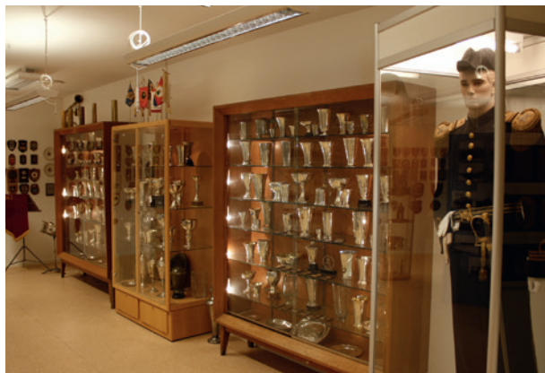
KA 2 minnesrum.