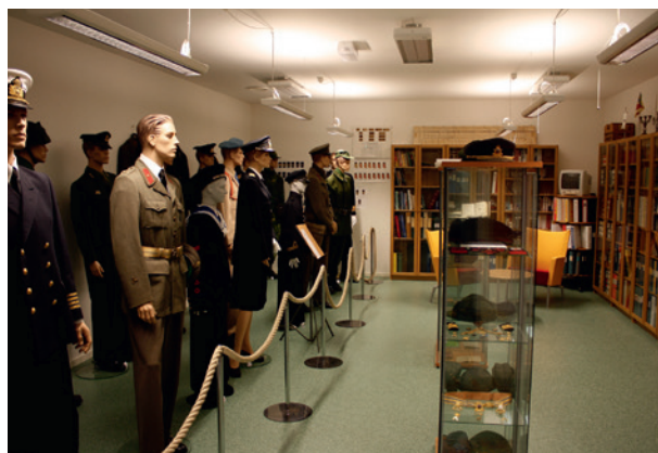
Litteratur- och uniformssamling.