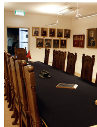
Ordersalsmöbeln och delar av