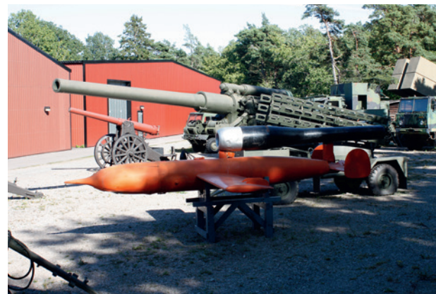
Delar av den yttre utställningen.