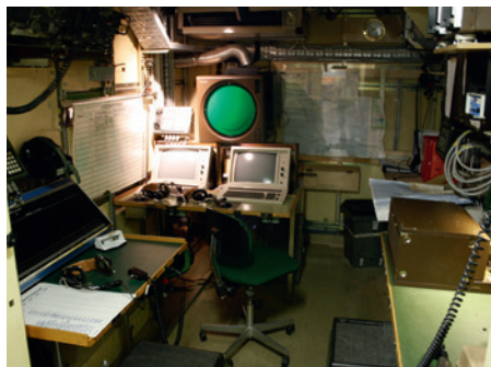
Interiör från batteriledningscentral (BLC) till 12/80 batteri.