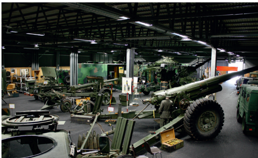
Vy över stora utställningshallen och i förgrunden 15,2 cm kanon m/37.