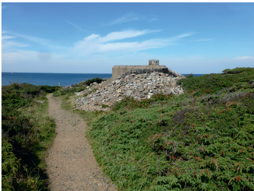
Pansarvärn 1557, Bjärehalvön.