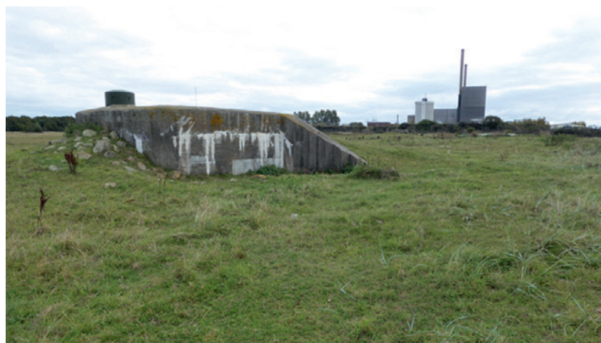
Pansarvärn 560, Barsebäck.