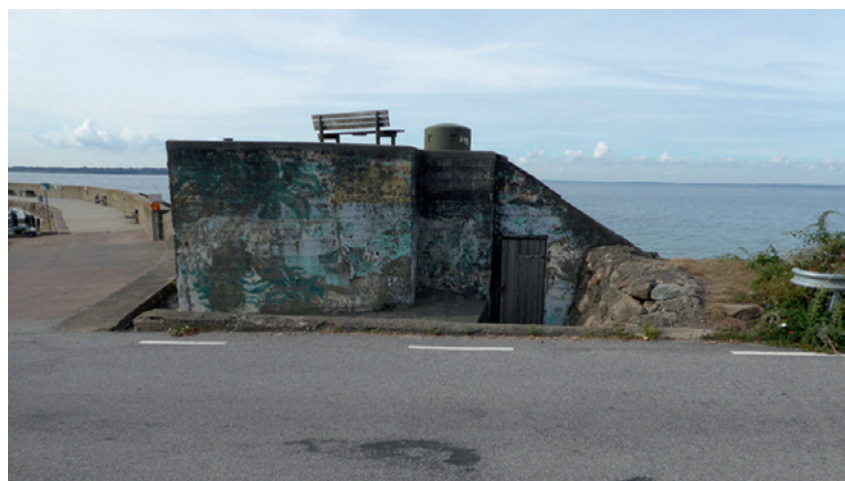
Kulsprutevärn 648, Ålabodarna Landskrona.

Det var under arbetet med inventeringen 2016 som projektgruppen kom i kontakt med berättelser av de som varit med och byggt värnen och »»