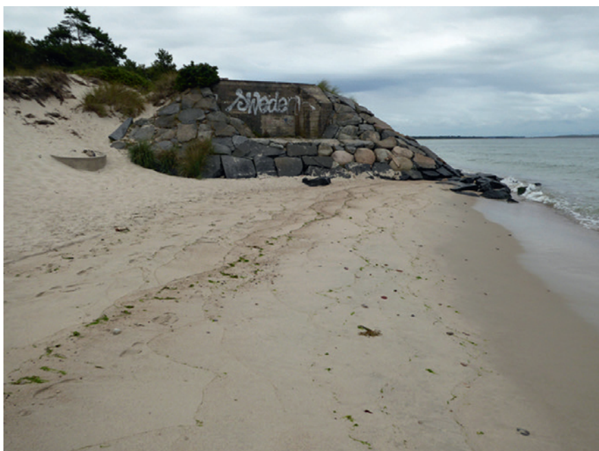
Pansarvärn 153, Hörte, Ystad.

Som museum vänder vi oss bland annat till arkiven för att få ytterligare kunskap. I detta projekt har vi hittills besökt Riksarkivet och Krigsarkivet i Stockholm samt Folklivsarkivet i Lund. Materialet som vi har tittat på ger en intressant dokumentation av ett land i krisberedskap. Ett exempel är de beredskapskurser i lantbruk som kvinnor uppmanades delta i för att avhjälpa bristen på arbetskraft inom jordbruket. Behovet var stort då både lantbrukare och säsongsarbetande unga män var inkallade. För Skånes del finns en intressant dokumentation från dessa kurser genom fotografier som visar utbildningens olika arbetsmoment, från mjölkning för hand till körning med häst. Att det saknades arbetskraft i lantbruket blir tydligt vid genomgång av arkivmaterial som finns hos Folklivsarkivet i Lund. Samlingen innehåller svaren på en frågelista som skickades ut 1997 med rubriken "Beredskapen". Här förtydligas situationen med direkta beskrivningar av de svårigheter det innebar för de som ensamma fick sköta både familj och jordbruk. Här återges också frustrationen hos de inkallade över att inte kunna hjälpa till. Situationen för lantbrukarna är bara ett exempel.