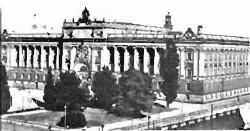
Här avgörs vid de fortsatta diskussionerna det definitiva utseendet av försvarets kostnadsram

Departementschefen föreslår för nästa budgetår en utgiftsram för det militära försvaret som i fasta priser i stort sett blir densamma som innevarande års utgiftsnivå.