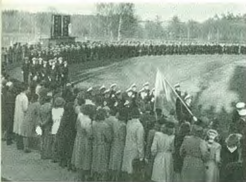
• Officerare ur F14 paraderade i maj 1945 på Örjans Vall i Halmstad, med anledning av upphörandet av de öppna krigshandlingarna i Europa.

N är den förstärkta försvarsberedskapen upphör med den 30 juni 1945, har ett flertal beredskapsförband under maj och de första juniveckorna återgått till sina depåer. En del materiel — främst personlig utrustning o d — har inlämnats till förråd. Annan materiel — däribland flygplan, motorer, vapen, stationsmateriel, radio- och fotografiutrustning m m — har mottagits vid verkstäder e d för att överses. Detta är i många fall mer än välbehövt efter det att materielen under lång och slitande beredskapstjänst använts från eller på tillfälliga baser, där förvaring utomhus oftast varit ofrånkomlig. Där har man i marktjänst måst arbeta i ur och skur, i snö och på is, ofta på lös och upplött mark. Under flygtjänsten i luften ibland i dimma, regn, snöstorm och hagel, allt långt borta från de ordinarie mera ombonade, permanenta flygbaserna. Nu återstår det mycket planering och mycket arbete av olika slag, som kräver ansträngningar, tid och en hel del kostnader, innan en fullständig återgång till fredsförhållanden kan anses ha ägt rum.