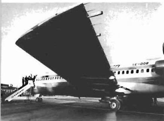
● Charterflyget ökar trafikledarnas arbetsbörda.