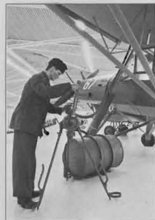
En prydlig "dock-tekniker" tankan- des en S 14 Storch. På detta sätt får man även se en del av kringutrust- ningen.