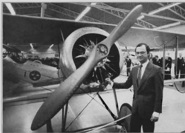
T h: HMK Carl Gustaf vid Ö1 Tummelisa.

De flygplan som måste exponeras utomhus har man måst korrosionsskydda. Företaget Tuff-Kote Dinal har en speciell teknik härtör. Här behandlas en tidig JA 37:a.