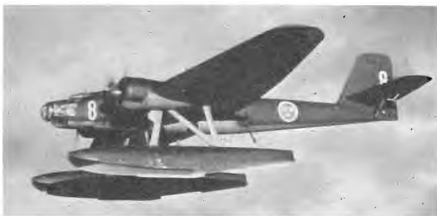
• Tvåmotorigt torpedflygplan T 2 ur F 2 — en av de vid krigsutbrottet 1939 för strategisk flygspaning över Östersjön insatta två flygplantyperna. Toppfarten var ca 310 km/tim.