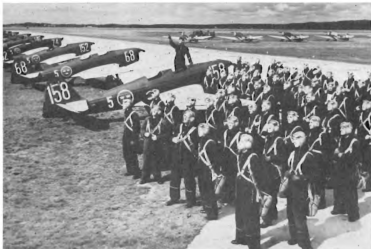
Utbildning av nya flygförare var ett av beredskapstidens många krav. Här en bild från F 5 år 1939, numera Krigsflygskolan på Ljungbyhed. Planen är skolflygplan av typ Sk 15 (Klemm 35), vilka tillfördes flygvapnet kort efter krigsutbrottet år 1939.

UNDER MELLANTIDEN har emellertid flygförvaltningen bl a hunnit med att den 24 april 1939 hemställa om ett nytt extra anslag av nya 6,3 miljoner (utöver de 5,4) för ordnande av 25 reservflygfält ("andra omgångens krigsflygfält") och en sjöflygslip. Det räcker dock inte enbart med förslag, pågående arbeten