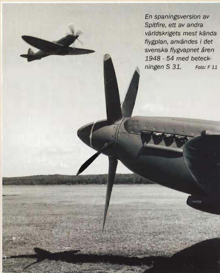
En spaningsversion av Spitfire, ett av andra världskrigets mest kända flygplan, användes i det svenska flygvapnet åren 1948 - 54 med beteckningen S 31.