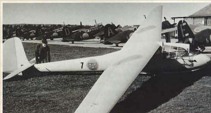
På 1940-talet fanns det militära segelflygplan för att främja flygkunnandet hos personalen utan flygtjänst. På bilden ses en Se 104 Weihe.