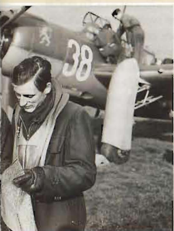
Piloter och tekniker ur F 13 i Norrköping uppställda vid den då nya J 22. En svensk konstruktion som var ett välbehövligt tillskott för luftförsvaret när den togs i bruk 1944.