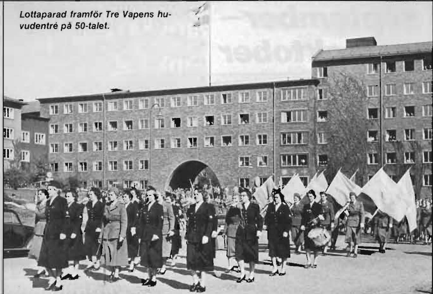
Lottaparad framför Tre Vapens huvudentré på 50-talet.

I 38 år har CFV med flygstabspersonal arbetat i lokaler uppförda på Stockholms militärrika Ladugårdsgärde vid Banérgatan 62, som efter inflyttning av Marinstab och de tre försvarsgrenarnas förvaltningar gavs namnet Tre Vapen. Efter regeringsbeslut på 70-talet är nu dock dags att skifta adress till Lidingövägen invid K1/flyttning till Bastionen (se pil och cirkel på bilden nedan). Där skall de tre försvarsgrensstaberna (m fl) samgrupperas med Flygstaben högst upp i denna moderna byggnad (på det s k flygplanet . . .). Flyttningen av FS avses vara genomförd i oktober –81.