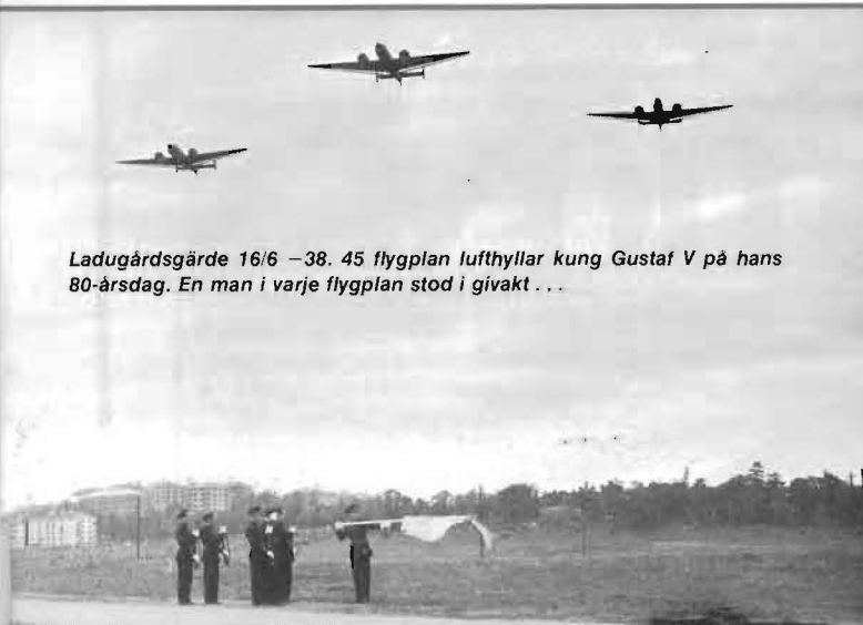
Ladugårdsgärde 16/6 –38. 45 flygplan lufthyllar kung Gustaf V på hans 80-årsdag. En man i varje flygplan stod i givakt . . .