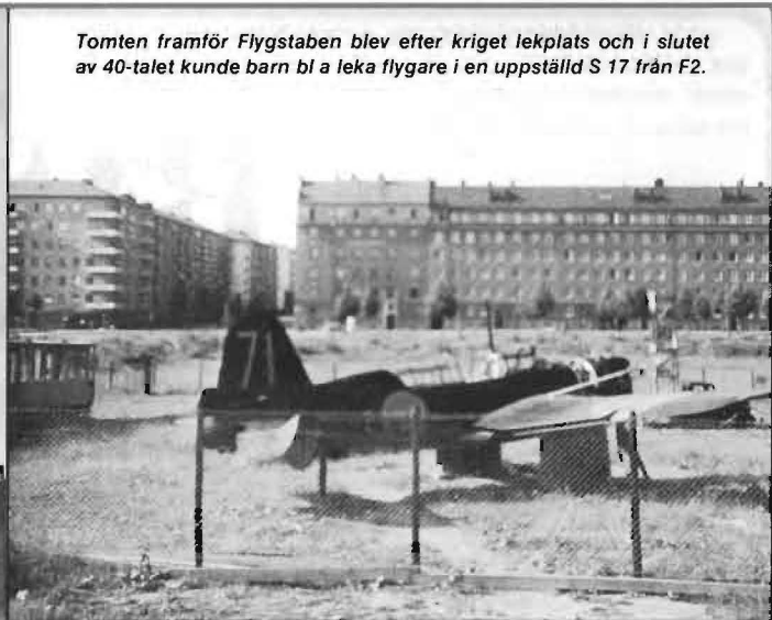
Tomten framför Flygstaben blev efter kriget lekplats och i slutet av 40-talet kunde barn bli lekflygare i en uppställd S 17 från F2.