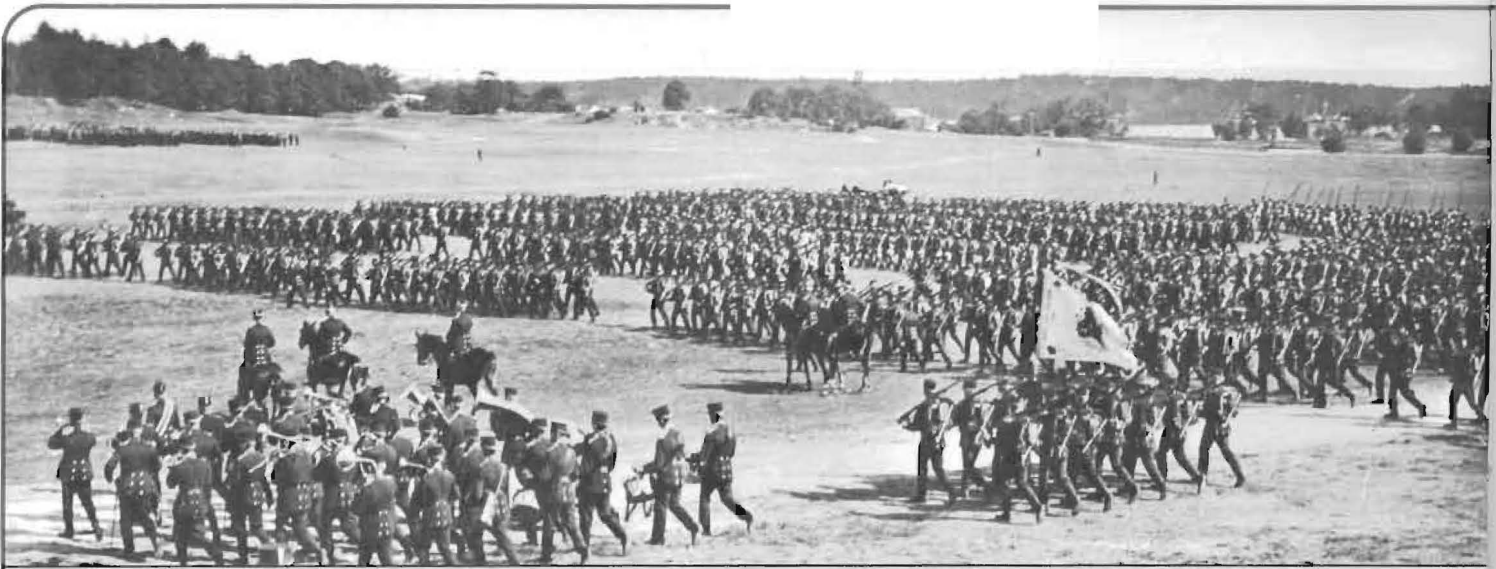
August Strindberg åsåg emellanåt exercisövningar på Ladugårdsgärdet. Dock ej denna 1920.