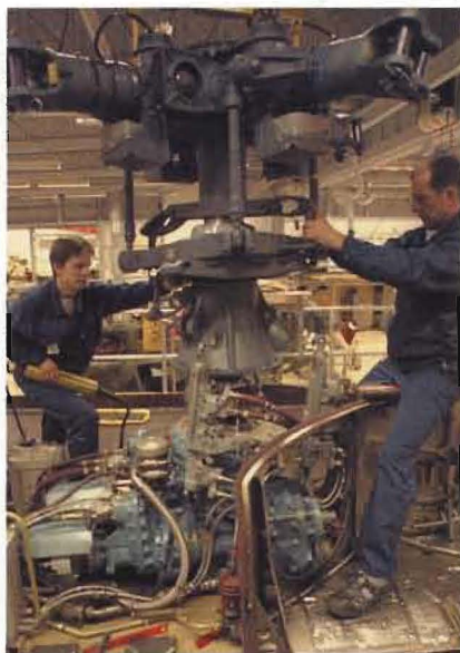
Tekniskt underhåll av HKP 10 Super Puma sker vid flygverkstaden i Luleå.

På motorverkstäderna utförs underhåll av flygmotorer med tillhörande startapparater till Viggen och Gripen.