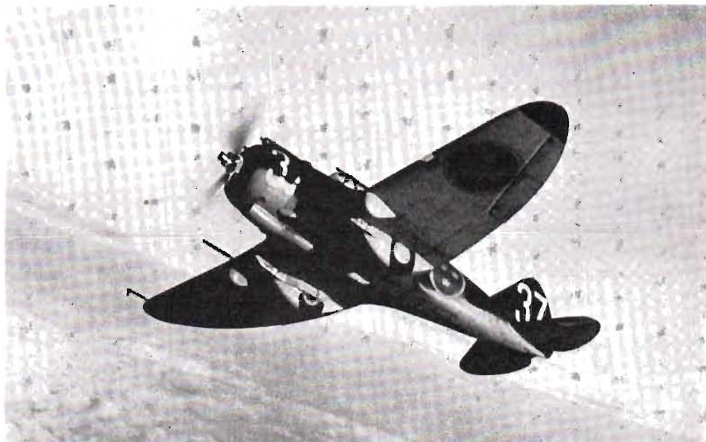
APRIL 1940: jaktplan J 9 ur den enda till F8 då levererade första divisionen. I maj—juni lyckades vi hemföra ytterligare bortåt 50 J 9 plan (Seversky-Republic EP-1) över finska Petsamo vid Ishavet, under stora äventyrligheter. Motor en 910 hkr Pratt & Whitney TWC3. Toppfart ca 470 km/tim. Två 8 mm fasta kulsprutor (motorstyrda) och två fasta 13 mm automatkanoner (i vingarna).

Sedan de ovannämnda april- och majkriserna ebbat ut och den närmaste krigsfaran för Sveriges del synes tillfälligt över följer en ny period, kännetecknad av fortsatta ansträngningar på försvarsmaktens områden — och därvid inte minst för flygvapnets stärkande. En rad nya utredningar och förslag framläggs då för statsmakterna. De klargör vilka åtgärder, som måste vidtagas genom riksdagsbeslut m m, för att öka tillgången på flygförband, personal, flygmateriel och produktionskraftig, effektiv flygindustri. Vidare kan noteras åtgärder för att tillgodose landets drivmedelsbehov. Flygvapnets ledning, dess chef, stab och förvaltning förser därvid i rask följd "ÖB" och försvarsminister med alla de grundliga, synnerligen arbetskrävande underlag, som behövs för framställningar och beslut.