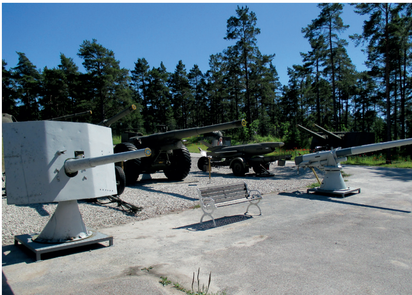
Delar av den tyngre marina materielen är uppställd utomhus. Under hösten 2015 påbörjas en byggnad som beräknas bli färdigställd under 2016.

Gjutningen av pjäsfundamenten var klar sista veckan i oktober 2014. Flyttningen skulle utföras av Åkericentralen, och innan november var