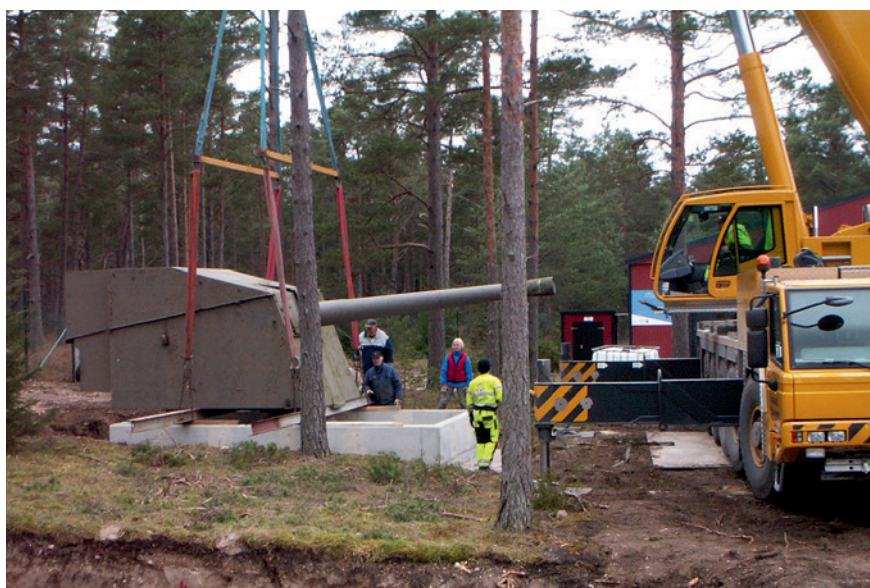
15.2 cm kanon m/1898 ställs på sin slutliga plats.