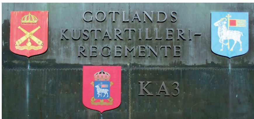
Skylden som mötte besökaren vid infarten till KA 3.

Men att driva ett museum kostar pengar, även om arbetsinsatserna är ideella. I samband med KA 3 avveckling såldes området till en entreprenör. Med denna har KA 3 Kamratförening haft ett utmärkt samarbete och man har bytt tjänster på ett för museiverksamheten gagneligt sätt. Men kostnader har ändå funnits, och under de senaste åren har SFHM, via Gotlands Försvarsmuseum, gått in med bidrag under en period medan framtiden för KA 3 museum utreddes. SFHM var måna om att hitta en bra lösning, huvuddelen av materielen tillhör ju staten med där åtföljande ansvar. Under hösten 2013 meddelade SFHM att det bara fanns två alternativ;