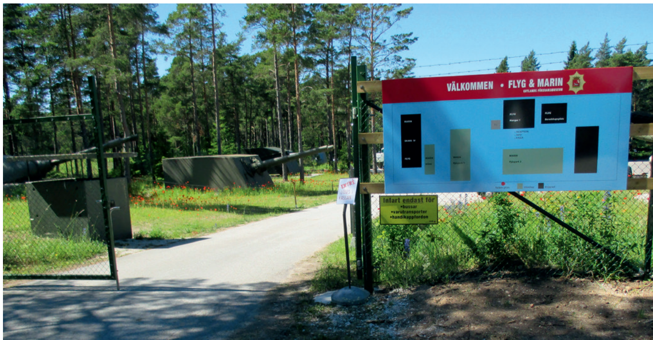
Infarten till Gotlands Forsvarsmuseums Flyg & Marindel vid Skans IV.

till ända fanns samtliga pjäser på plats på fundamenten i Tingstäde. Det var inga småsaker det handlade om. Det tyngsta lyftet var ett torn som vägde 53 ton, då hade det ”strippats” på de två eldrören som vägde 10 ton vardera!