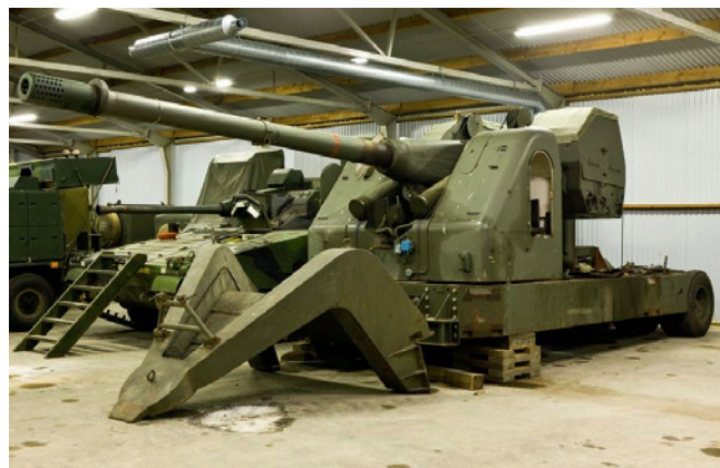
120 mm Ivakan FM1.