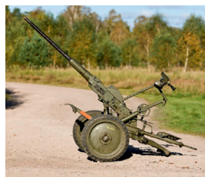
20 mm lvakan m/1940-70.