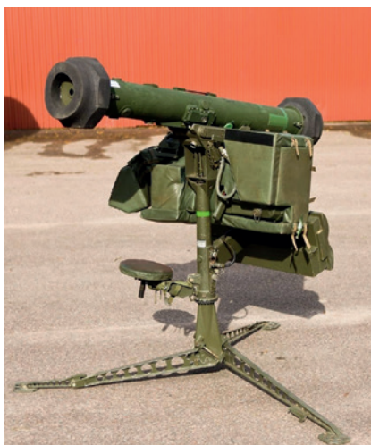
Robot 70 atrappstativ.

Därefter följer spanings- och eldledningsradar fram till PS 70.