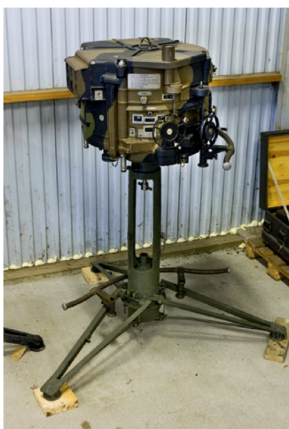
Centralinstrument m/40, modifierad m/36.

http://91anmuseet.se/luftv%C3%A4rnsamlingen.html