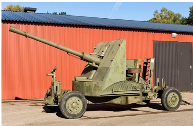
57 mm Ivakan m/54.