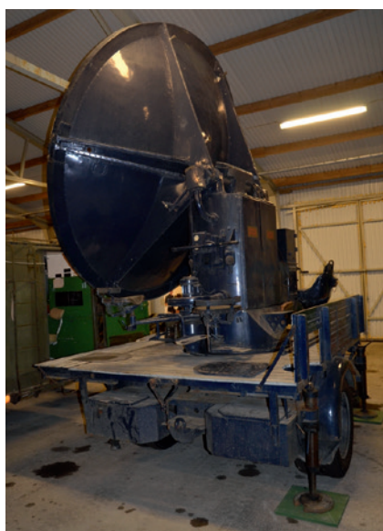
Radarstation Er2b. Radarskärm med manöverorgan monterad på transportkärra m/1937.