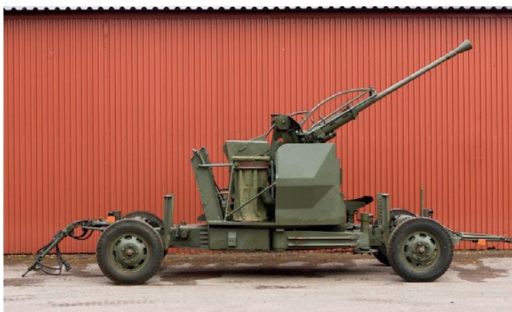
40 mm vakan m/48.