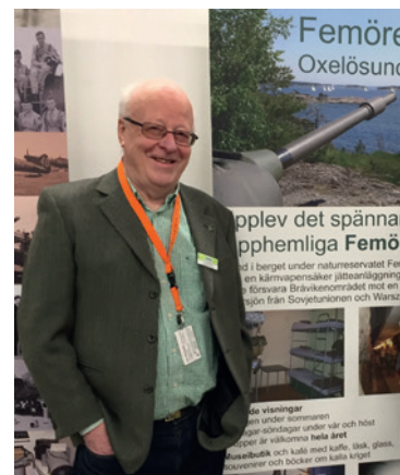
Text och foto: Per Rödseth, ordf och museichef.

Box 11, 613 21 Oxelösund 070-695 69 02 info@femorefortet.se www.femorefortet.se www.facebook.com/femorefortet/ www.instagram.com/femorefortet/ www.twitter.com/femorefortet