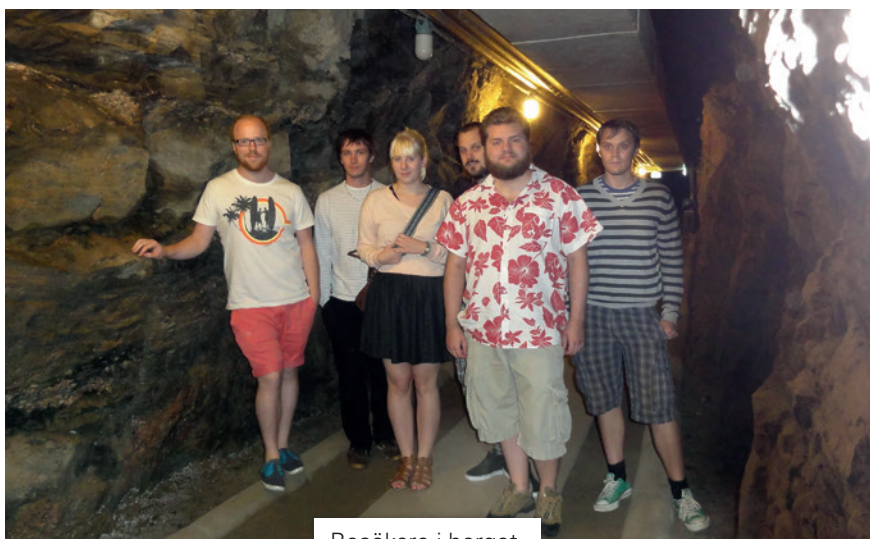
Besökare i berget.

Det var 1961 som den första sprängsalvan sköts vid byggandet av det stora kustartilleribatteriet på Femörehuvud i Oxelösund. Man började spränga sig in i berget under den bruna stuga som byggdes för att dölja huvudingången till anläggningen. Stugan är idag Femörefortets reception, museibutik och kafé. Själva utsprängningen av den jättelika berganläggningen var forcerad, man arbetade tidvis sju dagar i veckan och tidvis också 24 timmar per dygn. Byggandet skedde under stort hemlighetsmakeri och hela Femörehuvud var avspärrat för besökare under byggtiden. När väl sprängningsarbetena var avslutade startade installationsfasen, som omfattade installation av el, vatten, ventilation och alla dörrar, trappor, rum m m, samt alla vapen och vapensystem.