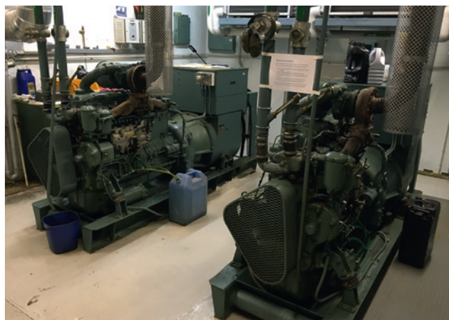
Kraftcentralen i berget.