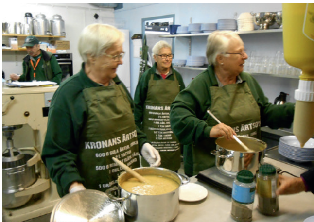
Köket i berget.