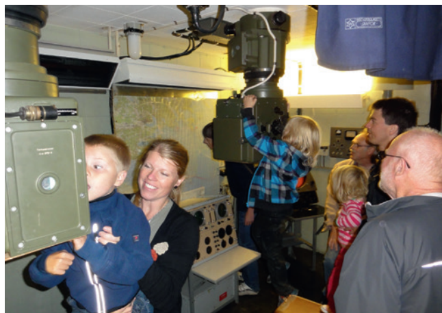
Stridsledningscentralen i berget.

Detta resulterade i bildandet av Intressegruppen för Femörefortets bevarande, som 2003 blev den ideella Föreningen Femörefortet.