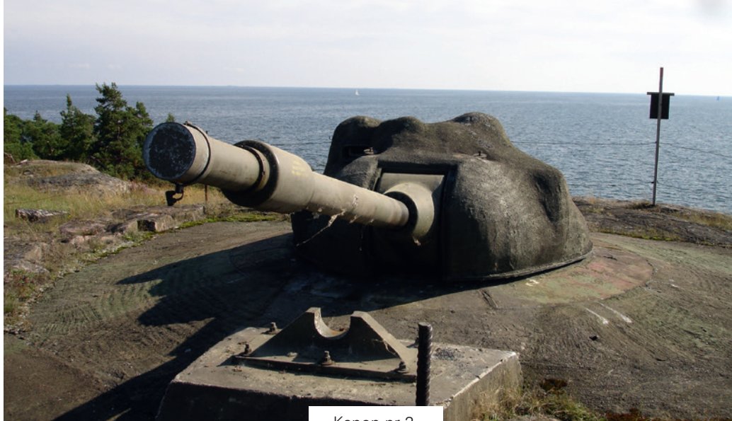
Kanon nr 2.

nisationen genomfördes totalt sex stora krigsförbandsövningar, så kallade KFÖ. Övningarna genomfördes 1966, 1971, 1975, 1983, 1990 och 1994. Övningen i september 1990 blev för övrigt den sista övningen med skjutning med kanonerna. Totalt 1800 skott har avfyrats med kanonerna på Femöre mot bogserade mål ute på havet vid övningarna. Mellan dessa övningar genomfördes ett stort antal mindre övningar i batteriet. Femörebatteriet var också en populär visningsanläggning som Försvarsmakten demonstrerade bl a för höga utländska militärer även från Warszawapakten. Detta som ett led i avskräckningen där motståndarna på andra sidan Östersjön skulle se att det inte gick att invadera Sverige utan rejält motstånd. Under tiden i krigsorganisationen hade Femörebatteriet namnet Batteri OD , detta för att namnet inte i onödan skulle röja batteriets placering. Bokstäverna O och D var för övrigt första och sista bokstäverna i Oxelösund. Under tiden i krigsorganisationen var anläggningen normalt obemannad, det var bara vid övningar eller liknande som batteriet var bemannat. Tillsyn och service på byggnaden inklusive el, luft, vatten m m sköttes av personal från Fortifikationsverket i Norrköping medan tillsyn och service på kanoner, elledningssystem m m sköttes av personal från dåvarande regementet KA 1 i Vaxholm. Det var bara vid större övningar som Femö-