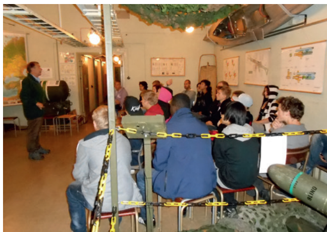
Föreläsningen i berget.

Upptakten till museet Femörefortet var ett uppdrag i lokaltidningen Södermanlands Nyheter år 2001. >>>