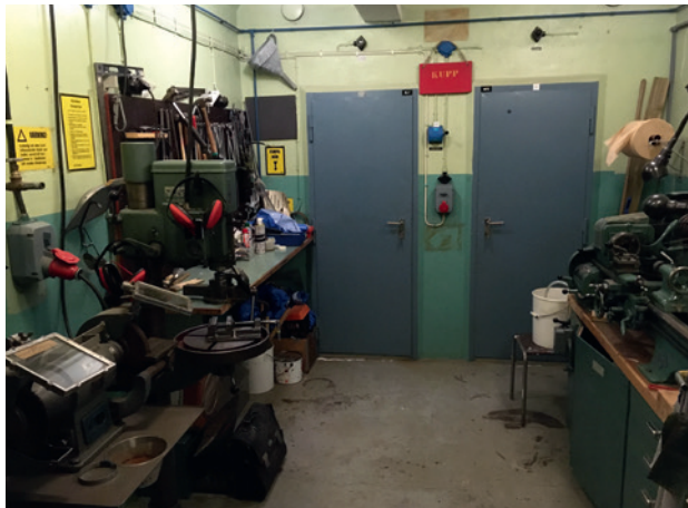
Verkstaden i berget.