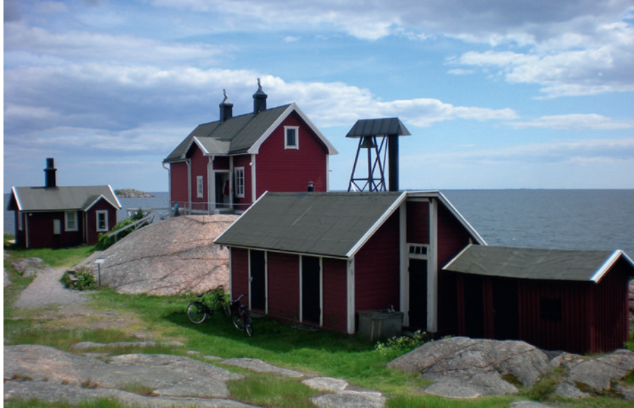
Fyrvaktarbostaden på Femöre.

matsalen i berget vilket är mycket populärt. Av besökarna utgör barn och ungdomar 25 % på årsbasis, under sommarsäsongen hela 30 %. Sommartid har vi också förhållandevis många utländska besökare, framförallt från våra nordiska grannländer men också Tyskland, Storbritannien, Polen och de baltiska länderna. Försvarmakten är sedan museets öppnande en av stamkunderna vilket vi som jobbar med museet naturligtvis tycker är extra trevligt. I Femörefortets reception/museibutik/kafé kan man förutom biljetter även köpa glass och fika samt köpa souvenirer och böcker om kalla kriget. Vi har Sveriges största samlade sortiment med böcker om kalla kriget, böcker som vi också säljer via postorder.