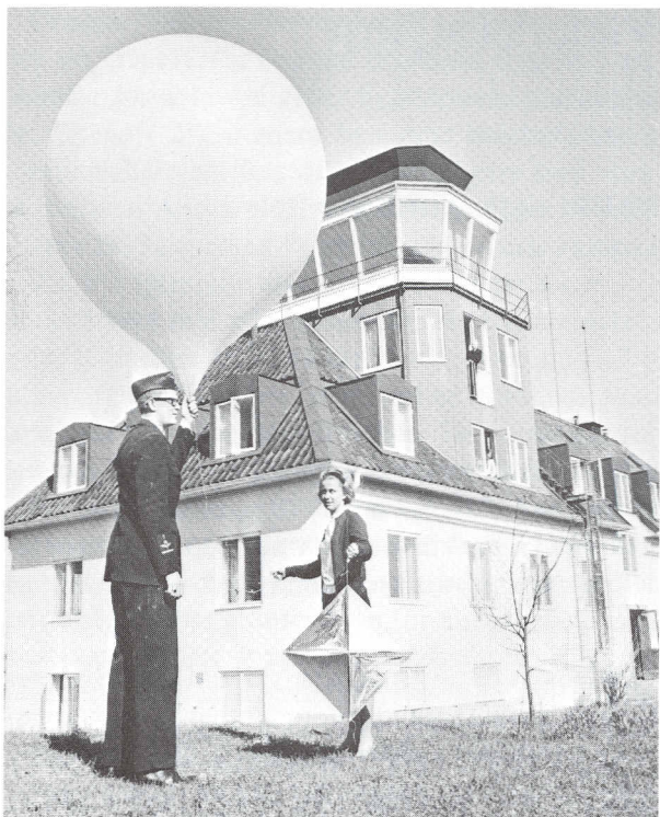
Ballongviseringar har alltid utförts på F 1. Här ses en senare typ av ballong med radarreflektor.

sationen efter en utredning 1943 och Militär Väderlektjänst (MV) i Stockholm växte till 7—8 personer 6 ).